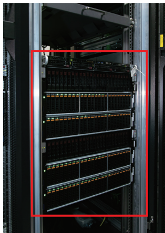
HDD使用時は280TBで7ラックあったが、現在は物理容量490TBがこのサイズ(13U)に

豊富な映像素材を、円滑に編集できる体制を整えて、2020年に備えるTBSテレビ。同社の番組を視聴する際は、その映像を生み出しているスタッフの方々、そしてサーバ室で黙々と動き続けるストレージにも、思いを馳せてみてください。